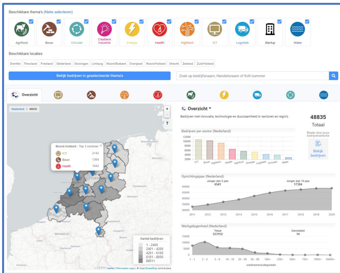
Afbeelding 1: homepage online Innovatiespotter

Vind, ontdek en doe je voordeel met de online Innovatiespotter! Maak bedrijvenselecties, blader door bedrijfsprofielen, spot trends en ontwikkelingen met de rapportagefunctie en maak slim gebruik van de analyse- en statistiektool.